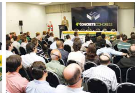
O Consultor Internacional, Jürgen Krell, durante sua palestra

aos novos desafios, são eles: excelência em gestão da qualidade, meio ambiente e tecnologia. Com relação à construção civil, o profissional apontou algumas questões que mostram que o setor de pré-fabricados está preparado para enfrentar, tanto no contexto técnico como de mercado, as novas oportunidades que tem se aberto para o país. Ele destacou que esse sistema construtivo tem capacidade para atender grandes escalas de produção, em um tempo reduzido de execução, com elevado padrão de qualidade, além da redução de desperdício, preservação do meio ambiente, entre outras vantagens.