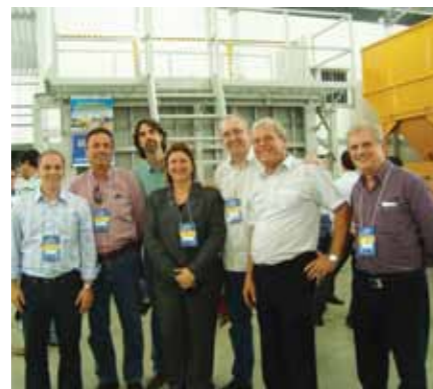
Associados Abcic prestigiam o evento da Weiler